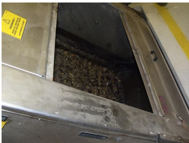
2. ábra – A finomrácsokba is betekinthettünk

A nemzetközi viszonylatban kis helyigényű szennyvíztisztító több mint 70%-a zöldterület, melyet a központi műtárgy tetejének növényzettel való befedésével oldottak meg. A telep tervezése és építése során lényeges feladat volt az Európai Unió és Magyarország irányadó környezet-terhelési kibocsátási határértékeinek betartása, valamint az építészeti és városképi szempontoknak való megfelelés is.