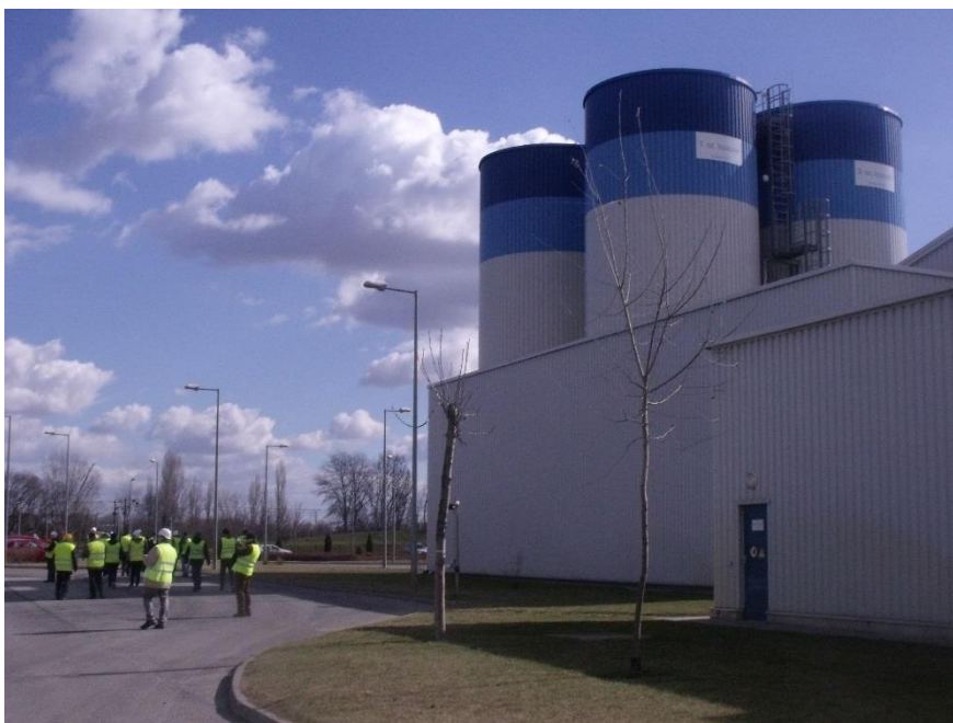
3. ábra – Az iszapszilók és a csoport

A második lépés a rothasztás, melynek részeként először 30 percig 70 °C-on pasztörizálják az ide kerülő anyagot. Ezután termofil anaerob rothasztás következik, amely során szigorúan 55-56 °C között kezelik az iszapot három 6 m 3 -es tartályban. A szerves anyagokból biogáz lesz, itt kapcsolódik be a telep működésébe az energetika. A hátról egyszerre kettő működő 1400 kW-os gázmotor segítségével áramot termelnek, mely az üzem villamosenergia szükségletének minimum 60%-át fedezni tudja. A keletkező hőt is hasznosítják, ezt a fűtőkörök a rothasztóhoz szállítják.