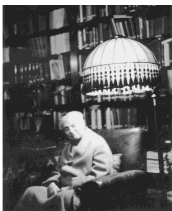
Az idő sődő Zipernowsky Károly 1939-ban

Zipernowsky Károly 1942. november 29-én hunyt el, életének 90. évében. Óbudán található róla elnevezett iskola és utca, a Budapesti Műszaki és Gazdaságtudományi Egyetem Villamosmérnöki Karának dékáni láncán a tudós arca látható, illetve az egyetem főépületében helyezték el mellszobrát.